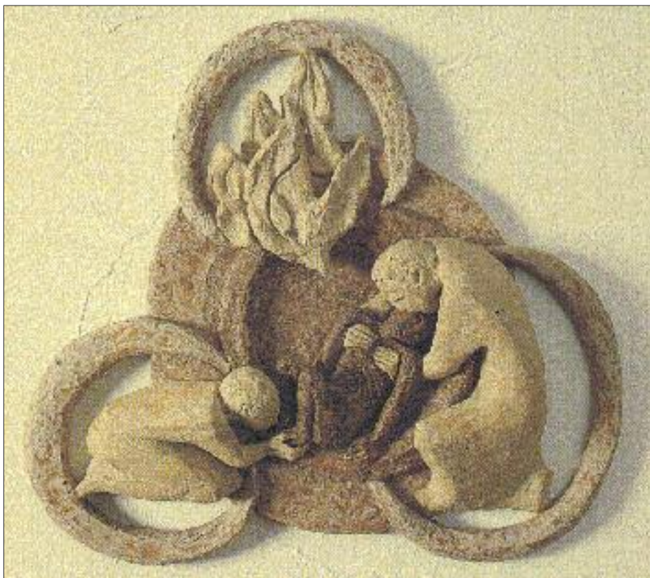
Trinité miséricordieuse, céramique réalisée par sœur Caritas Müller.

Si Dieu n'a pas fait disparaître le mal du monde d'un coup de baguette magique, son intervention contre le mal n'en dépasse pas moins nos concepts limités. Après que le péché soit entré dans le monde, et avec lui toutes les formes du mal, Dieu répond à la gravité du péché par la plénitude du pardon. La bonne nouvelle, c'est que le