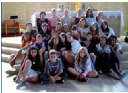
Retraite de profession de foi à Grisy-Suisnes.

En un mot, le Pôle est porteur et fédérateur. Je m'arrête là, je suis obligée de freiner mon enthousiasme !