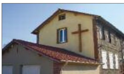
Le presbytère de Chevry-Cossigny.

La croix installée à l'entrée située près de la Poste, a l'avantage d'être grande et remarquée par toute personne qui y passe. L'installation d'une croix dans un endroit donné a toujours voulu signifier la présence du Dieu sauveur au milieu de son peuple. La croix est ce signe de ceux qui appartiennent au Christ. Elle est le signe du salut que le Christ nous a acquis en mourant et en ressuscitant d'entre les morts.