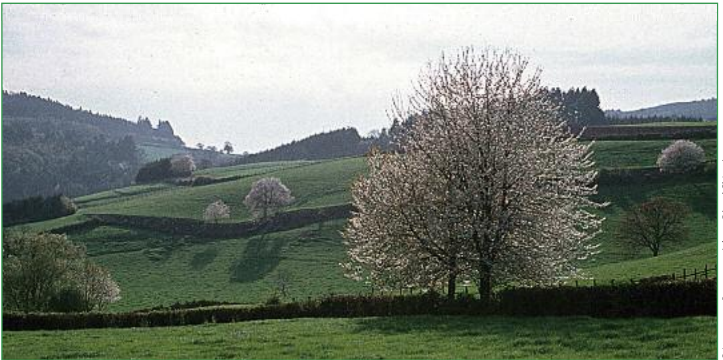
Printemps en Bourgogne