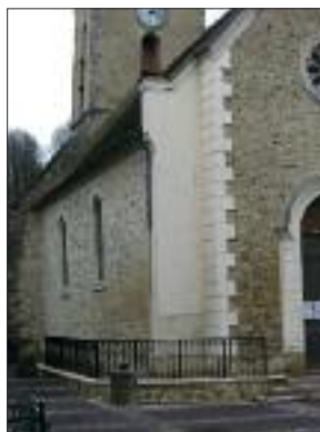
L'église de Lieusaint : rampe d'accès pour handicapés.